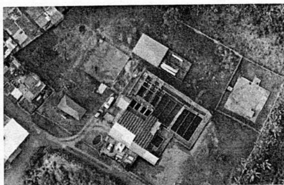
FIGURA N°2 - LOCALIZACIÓN DEL PROYECTO.